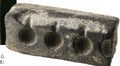
本丸跡出土遺物の火縄銃弾丸鋳型