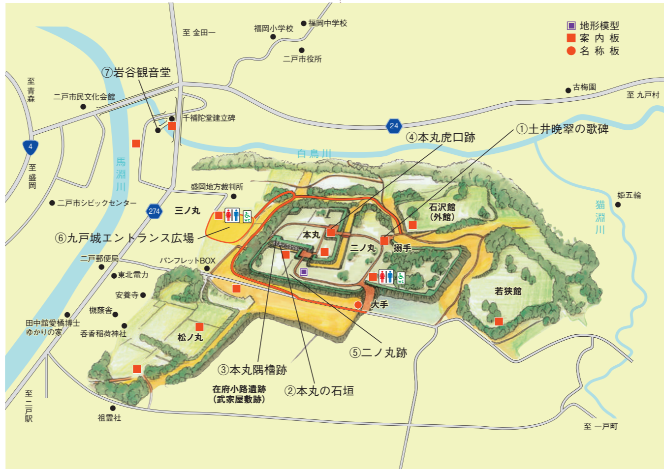
史跡九戸城跡及び周辺案内図

エントランス広場の東側には土塁と堀跡があり、その先に本丸を望むことができます。また、エントランス広場には休憩できるガイドハウスがあります。この広場を起点に、本丸・二ノ丸の下方にある腰曲輪を抜け、城跡を広く散策することができます。