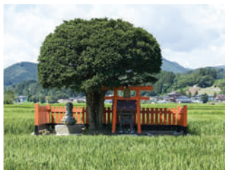
亀千代斬殺の場（青森県田子町）

永正元年（1504）開山の古刹で、かつてはこの地域一体の文化の中心であるほか、九戸氏代々の菩提寺としても知られます。境内にある村指定の大イチョウは、政実が出陣の時にお手植えしたものと伝えられています。