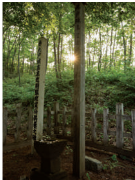
政実公の首塚（九戸村）

承和9年（842）の創建と伝えられる九戸地方の総鎮守。九戸家代々が戦勝を祈願した神社として知られています。