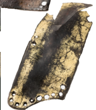
二ノ丸跡出土遺物、漆塗りの上に 金泥を使用した鎧の札（さね）