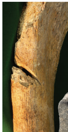
大腿骨上部の刀創