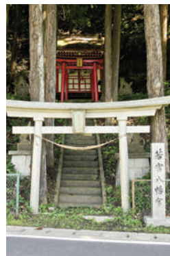
若宮八幡宮（青森県田子町）

九戸城落城時、13歳と伝えられる政実の一子亀千代には生存説・斬殺説と共にゆかりの地も数カ所伝えられており、この若宮八幡宮は斬殺された亀千代を祭神としています。