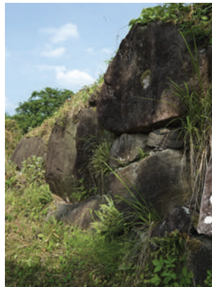
本丸隅櫓（すみやぐら） 跡脇石垣