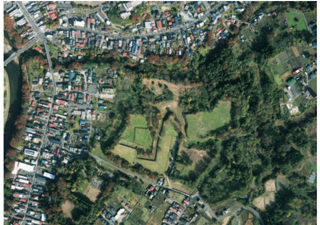
九戸城跡（平成27年撮影）

平成7年（1995）、二ノ丸大手門近くで九戸城落城直後に掘られたと思われる粗末な墓穴から、首のない人骨十数体分が発見されました。これらには無数の殺傷痕や刺突痕があり、平成20年（2008）に東北大学医学部で再調査の結果、女性も含まれていることが分かりました。地元で伝わる伝承や後世の軍談記にある撫切りの犠牲者と考えられています。